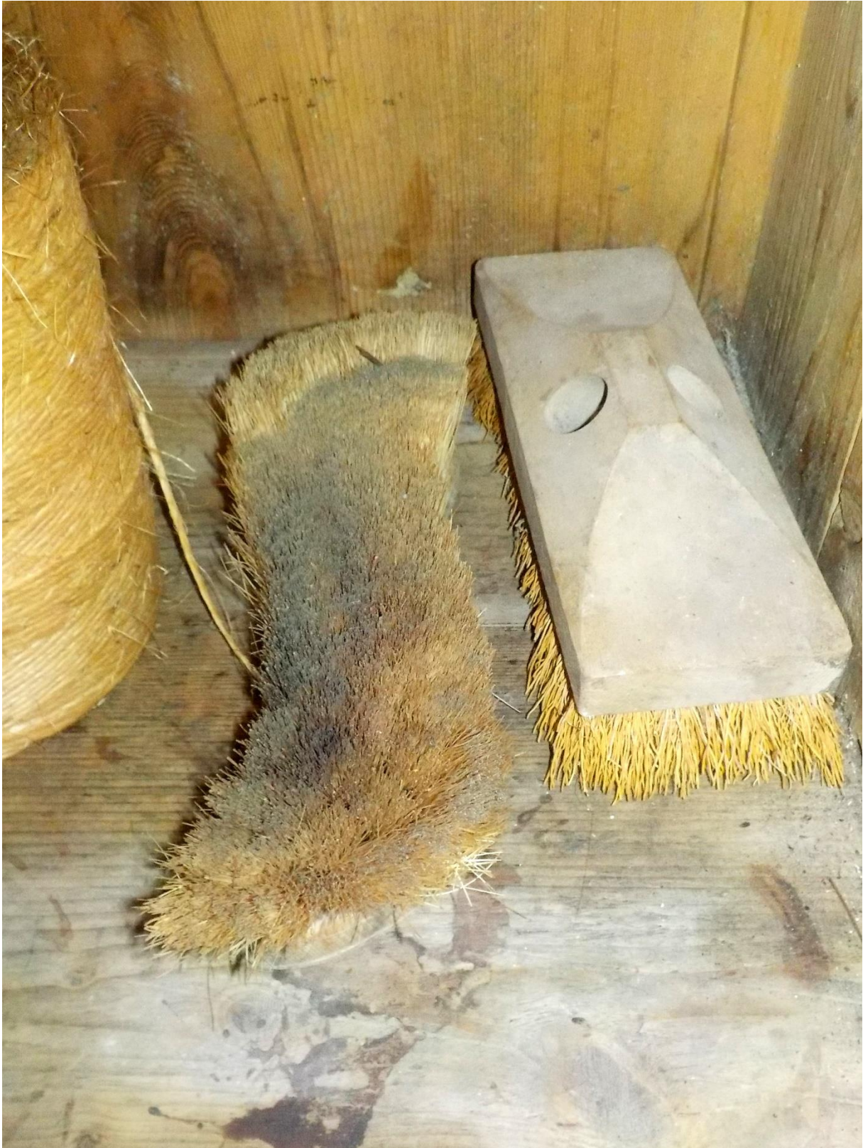
Brosses risette, l'une pour le nettoyage des objets, l'autre pour récurer la cuisine. Une fois l'an !