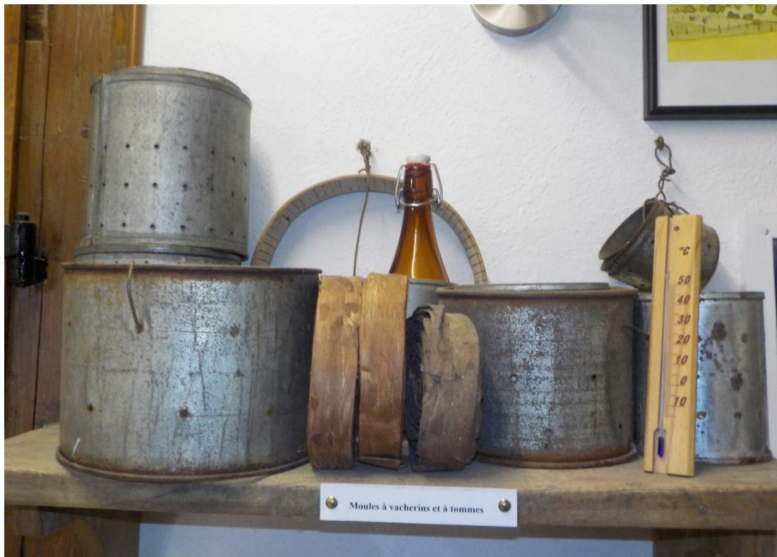
Anciens moules à vacherin en fer-blanc.