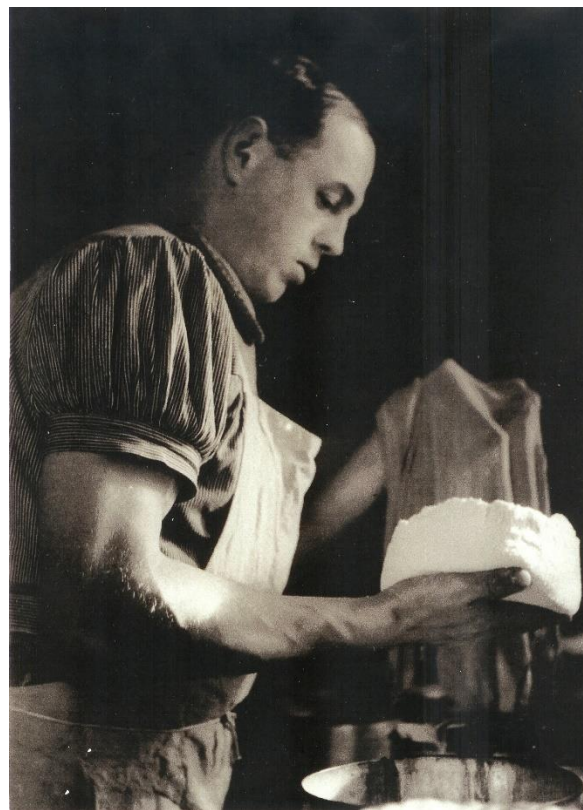
La masse du caillé déjà compacte est prête à être découpée en tranches qui seront sanglées.