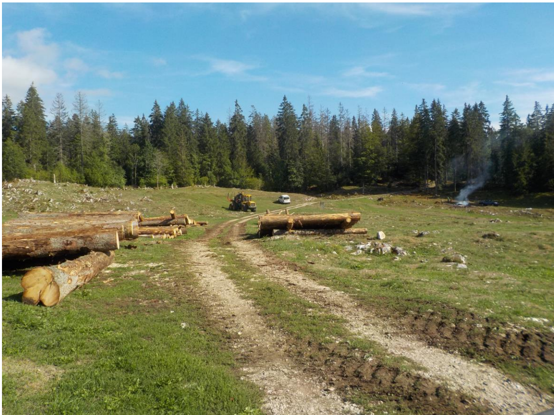
Territoire nommé Chaufour. Allez contre la fumée et vous trouverez le Chalottet au-delà du bois.