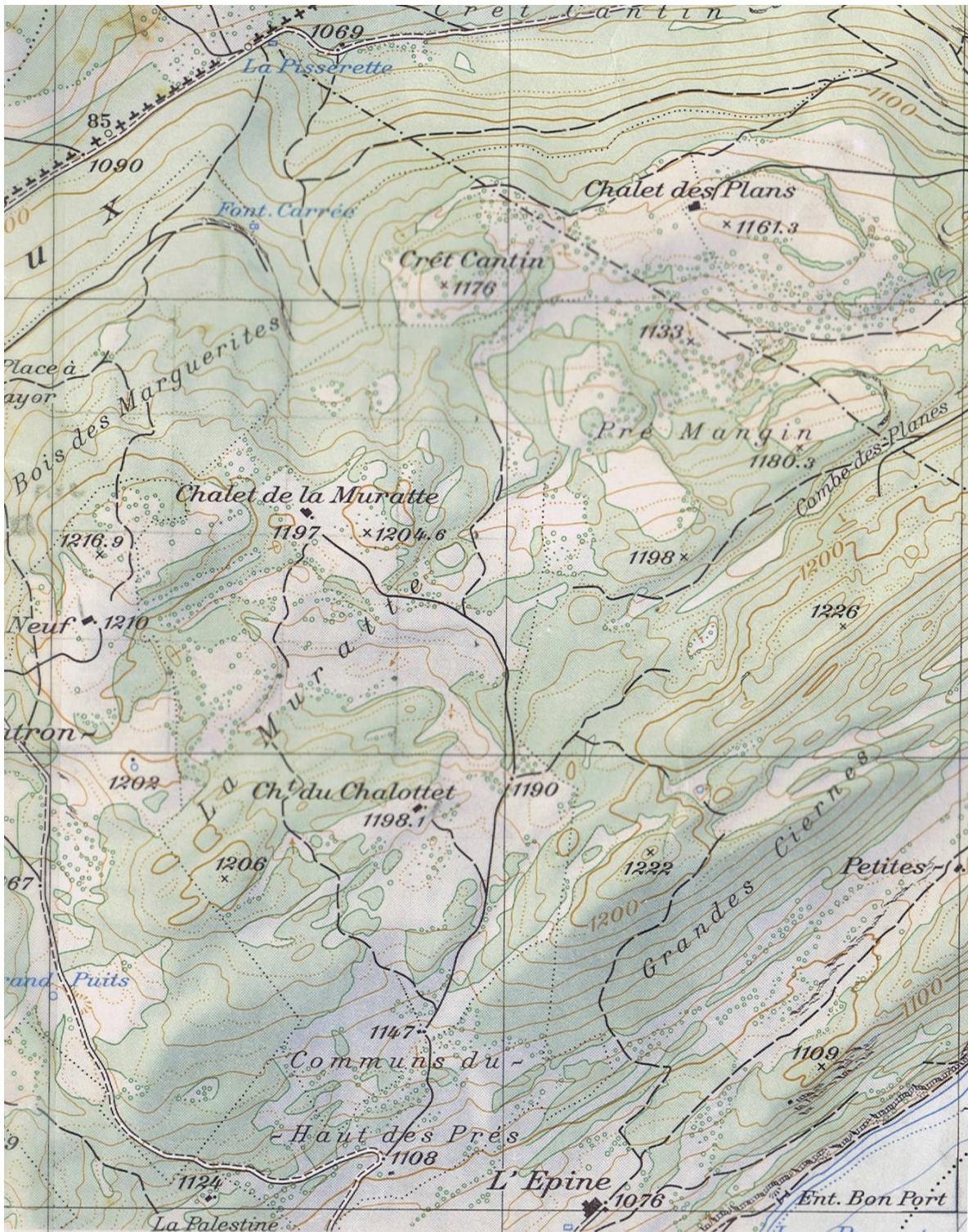
Carte fédérale Mouthe, 1958, au 1 : 25 000. L'ancien chemin pou les deux Muratte, soit nos Mallevaux-Dessous et Mallevaux-Dessus, n'est qu'esquissé.