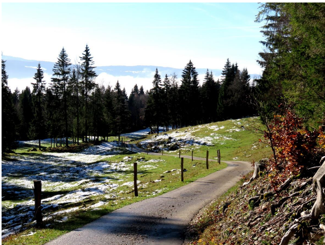
Descente sur le Couvert depuis le plat du Chalottet.