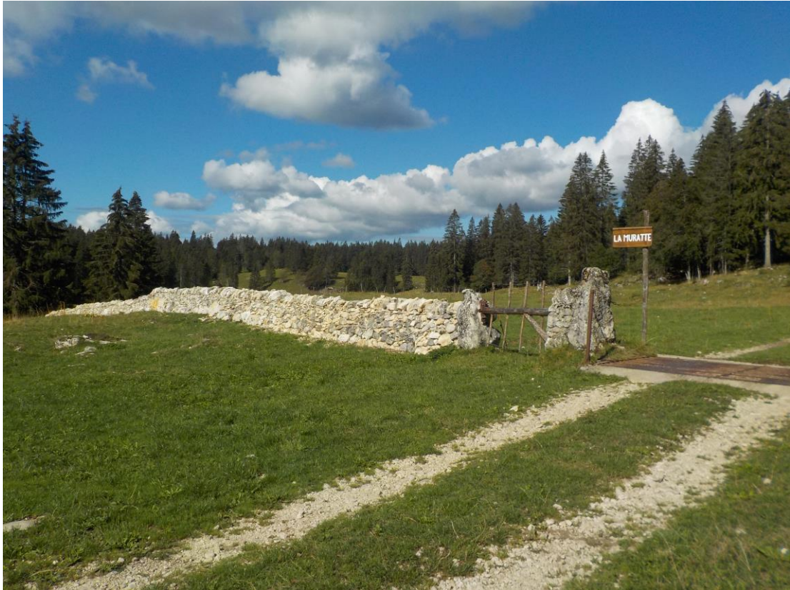
Le mur de séparation des deux alpages.