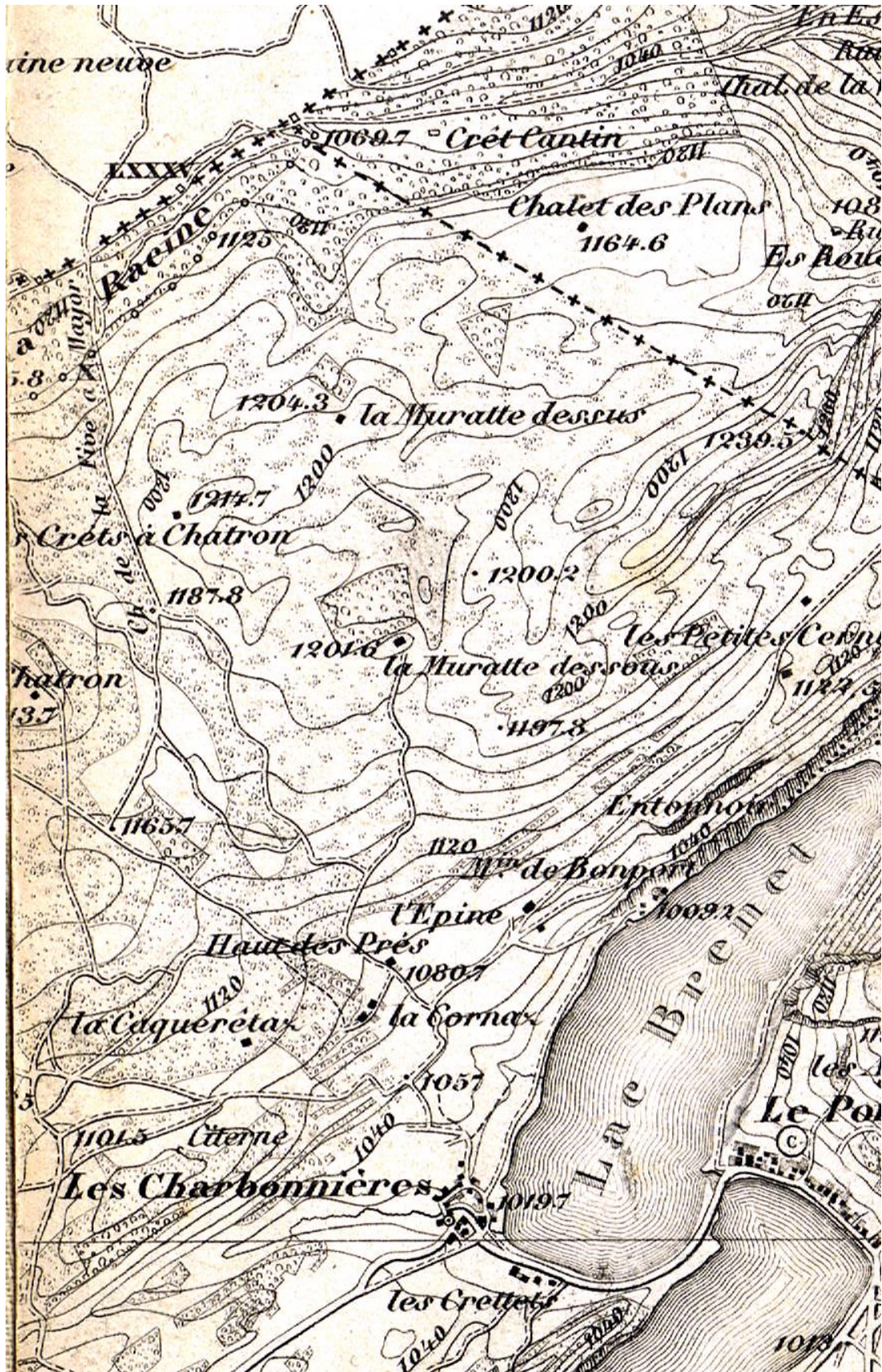
Carte topographique du canton de Vaud, 1877/1880. Un chemin conduit jusqu'à la Muratte dessous, mais par contre n'est qu'esquissé plus loin.