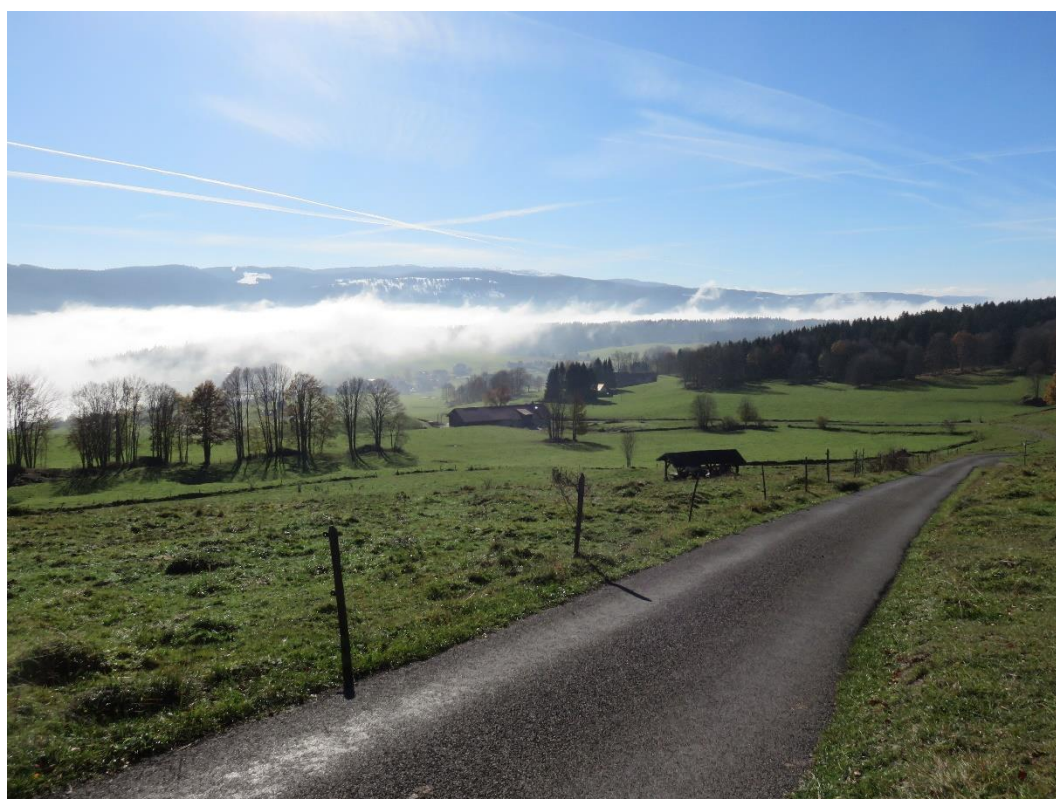
Les Communs du Haut-des-Prés, avec dans le bas, la ferme. A mi-distance, le couvert.