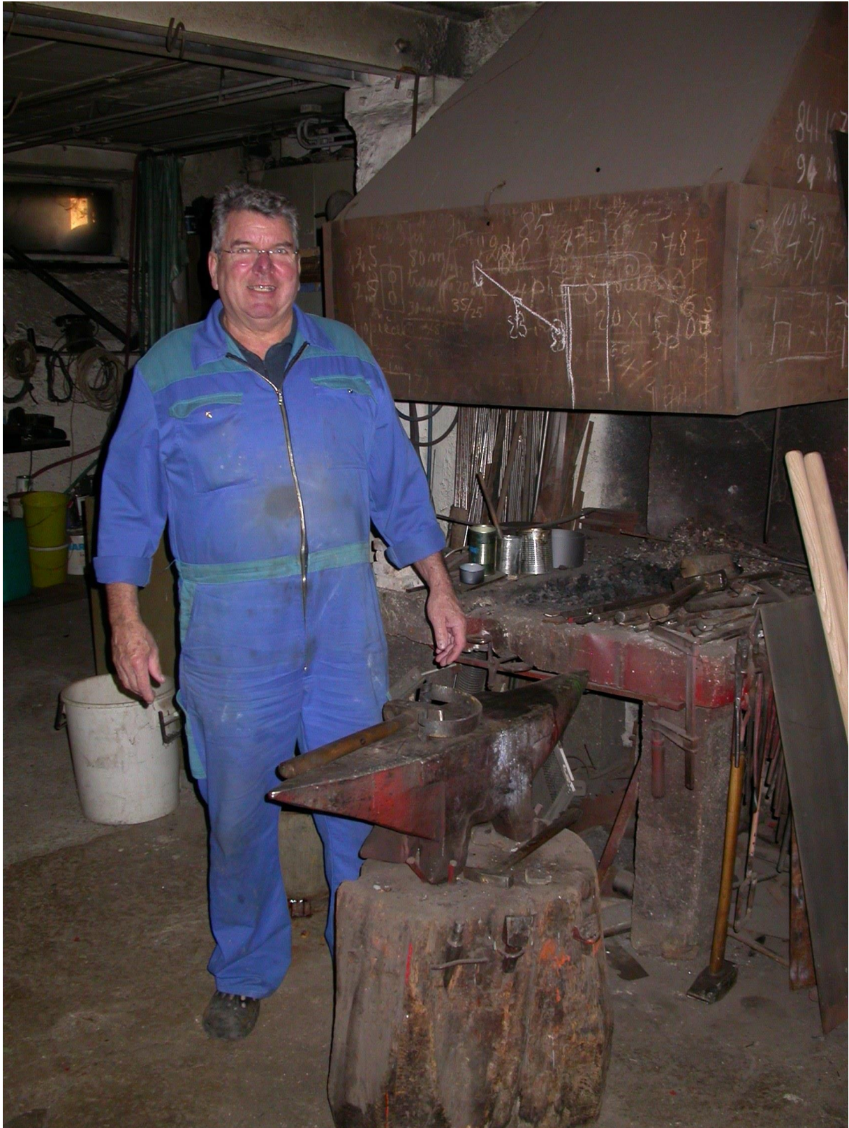
La forge des Charbonnières vers 2010. Le ferrage des chevaux se faisait sous la remise annexe.