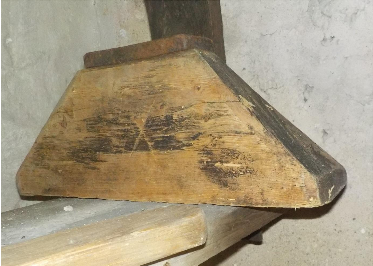
Plot de serrage simple mais de forme trapézoïdale.