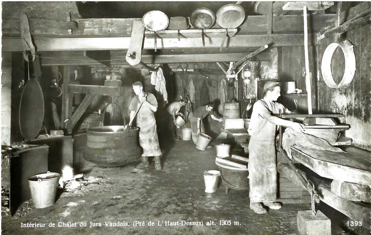
Retour au Pré de l'Haut-Dessus. Le croisillon est visible à droite de la photo.