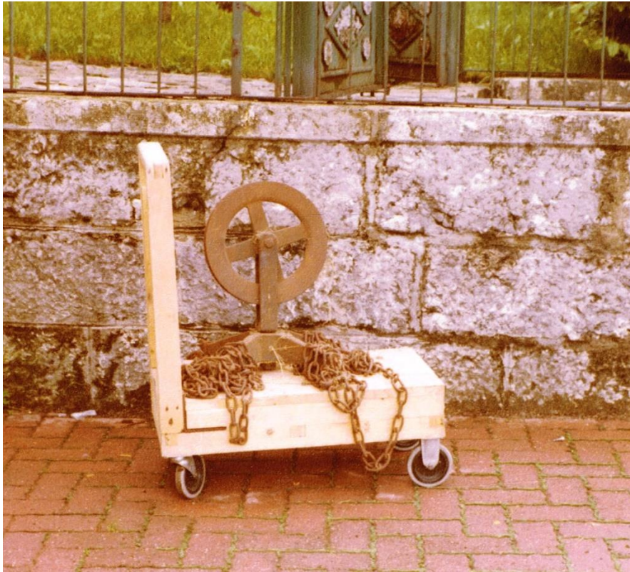
Le croisillon du monte-charge de chez Saïset. Pour le mouvement lui-même, manivelles, treuil, roue dentée, clapet de retenue, probable que tout cela ait disparu.