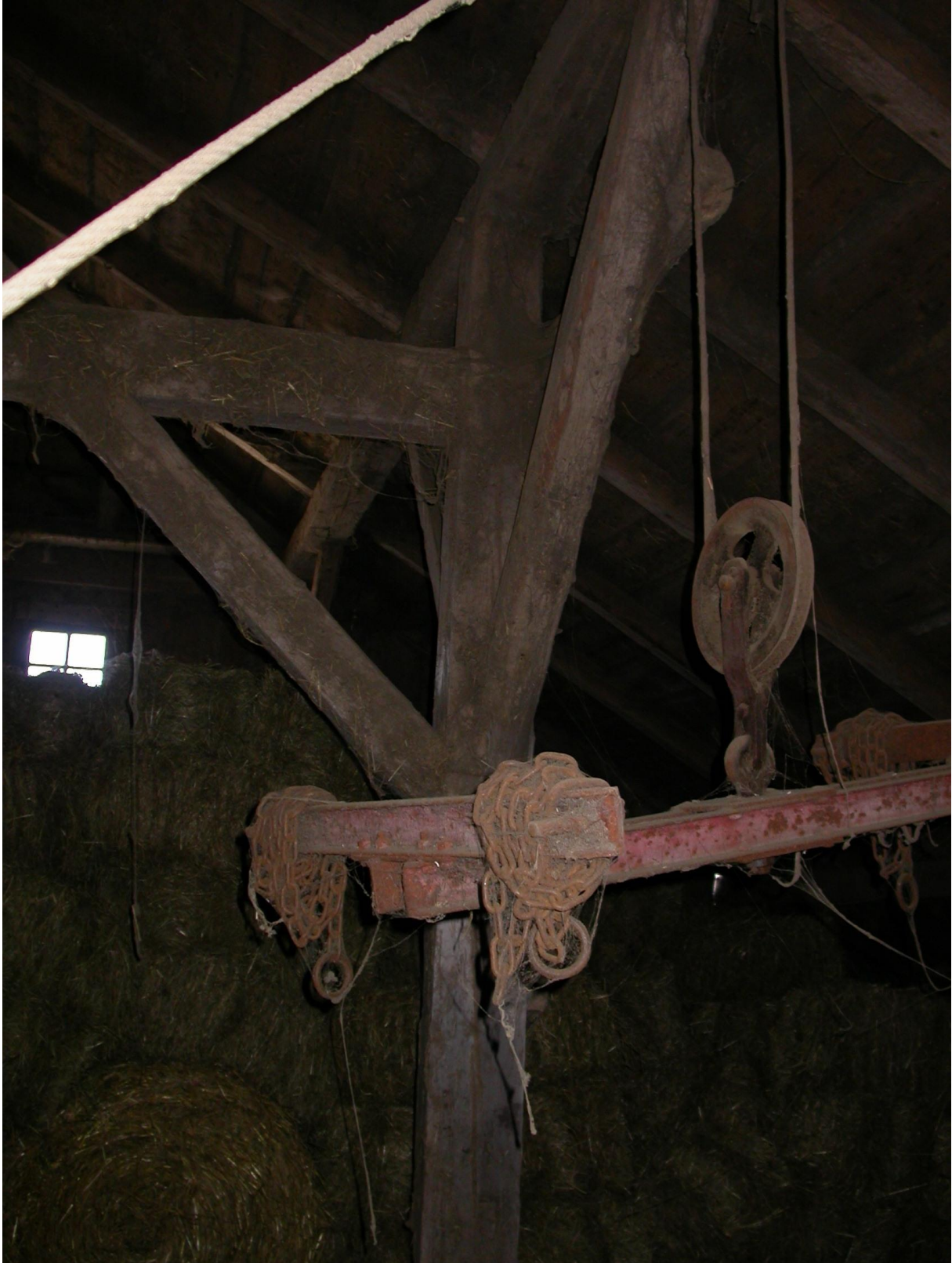
Même grange, monte-charge ancien.