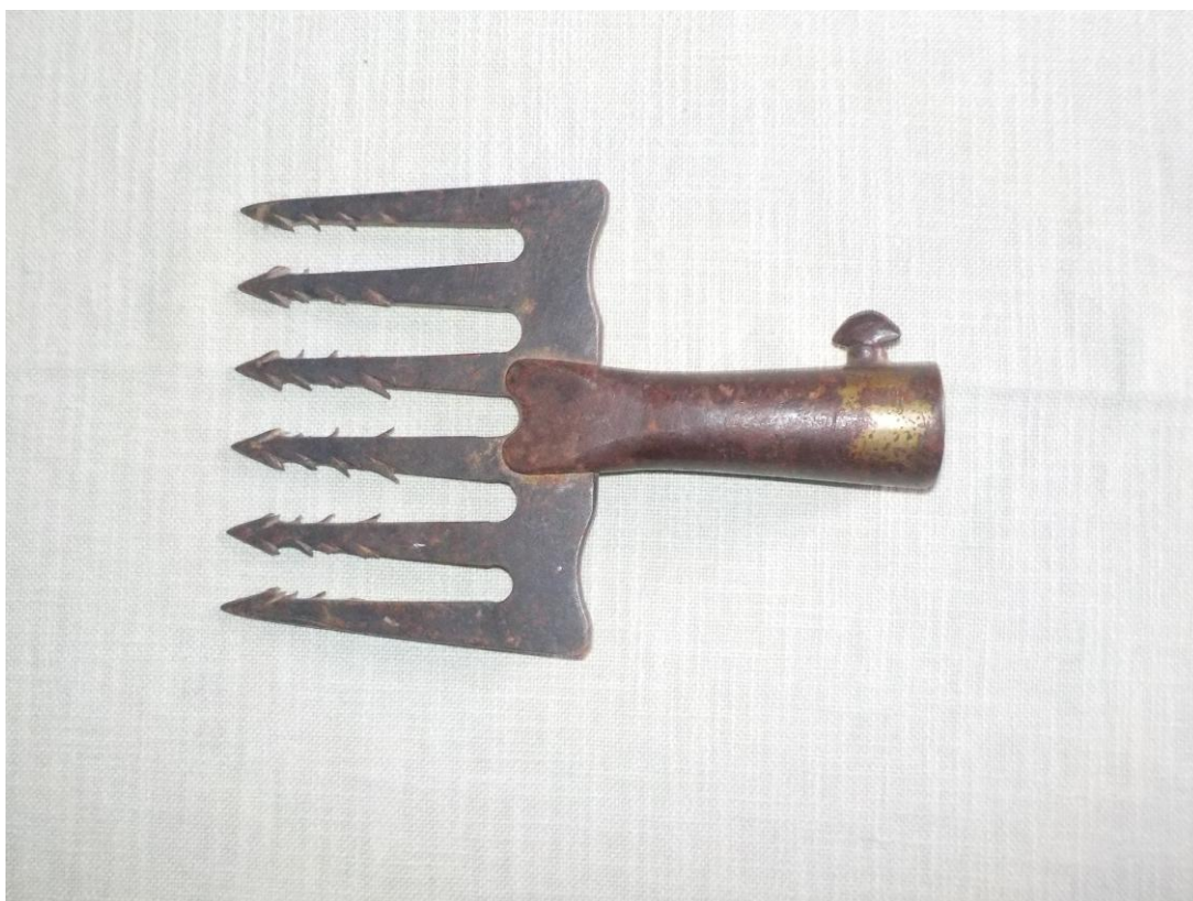
La foën du Patrimoine.