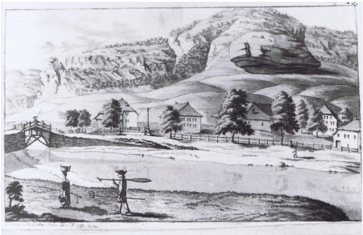
Escher, 1784. Nous sommes sur les Epinettes, à proximité du Pont de la Goille. De l'autre côté du bras du lac, l'Auberge des Deux Poissons, si telle elle se nommait déjà.

En patois on lui disait sans doute la founâ. Il s'agit de cet outil à trois ou quatre pointes ou plus, chacune ayant la forme d'un gros hameçon, avec lequel on attrapait les poissons que l'on pouvait voir à peu de distance, soit au bord même du lac, soit d'un bateau. Par un geste violent, l'instrument pénétrait dans la bête et ne pouvait en ressortir. Moyen simple et un peu barbare qui dut s'utiliser depuis la nuit des temps. Une gravure en témoigne en ce qui concerne notre Vallée de Joux :