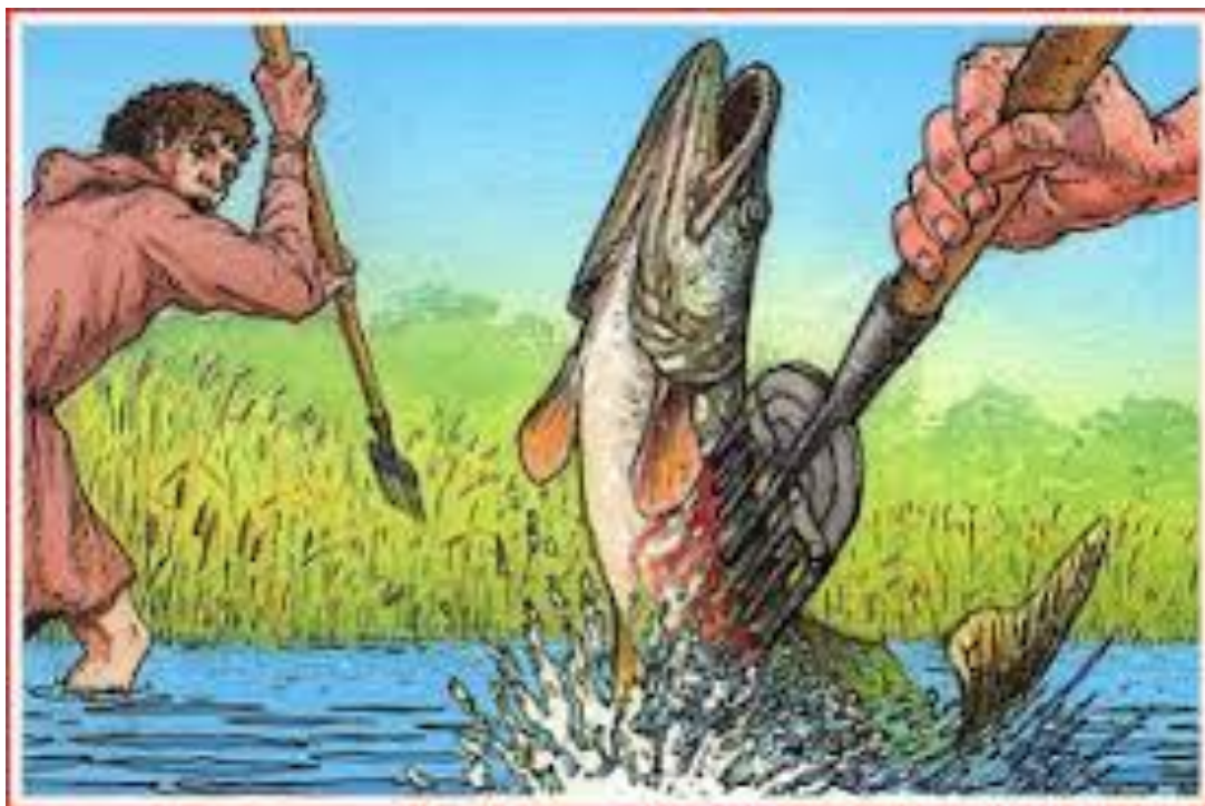
Un outil utilisé depuis les temps les plus reculés.