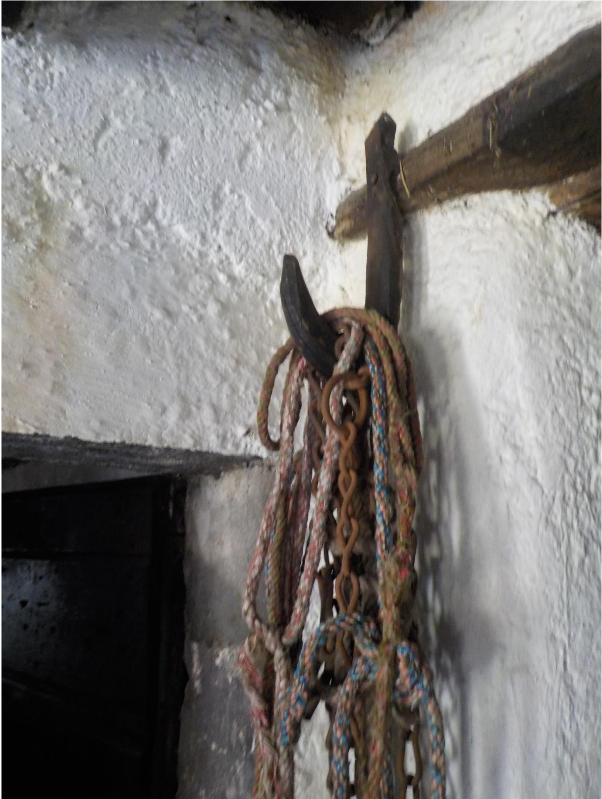
A la cuisine, à l'angle, entre deux portes, là où l'on passe toujours.