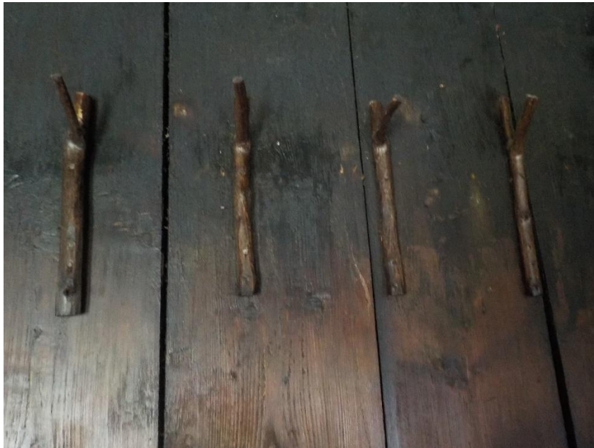
A la cuisine, contre une paroi.

On les trouve un peu partout dans les chalets, éléments des plus discrets et pourtant d'une grande utilité. Ils ont le plus souvent été taillés directement dans une branche de sapin qui avait la forme adéquate. Ils ne coûtent donc rien. On les cloue ici ou là, à la cuisine, dans une chambre à coucher, et même à l'écurie. On ne les voit plus. Raison aujourd'hui de les mettre un peu en évidence.