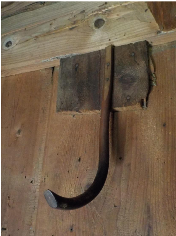
Une chambre à coucher.