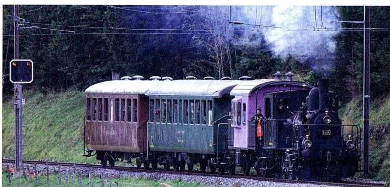
Le train à vapeur en mouvement

À l'occasion de cet événement, la gare du Sentier-L'Orient s'est parée de ses plus beaux atours. Samedi 7 septembre, environ 150 curieux et personnalités officielles ont eu le plaisir de profiter d'un magnifique voyage en train à vapeur au départ de la gare du Pont. À son arrivée, annoncée par ses volutes de fumée et son sifflement caractéristique, une petite foule joyeuse attendait sur le quai. Après la partie officielle et un rafraîchissant apéritif, la journée s'est poursuivie avec des spectacles de cirque et d'autres événements qui ont été fort appréciés par le public.