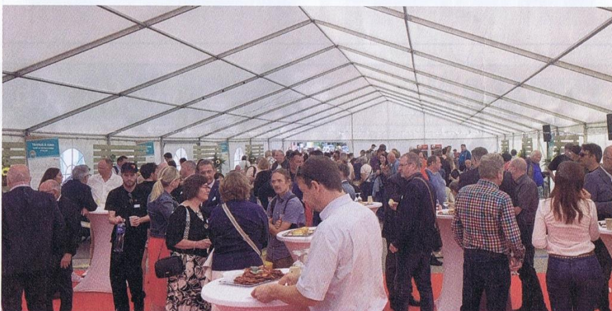
Après la partie officielle, les participants ont pu profiter d'un rafraîchissant apéritif.