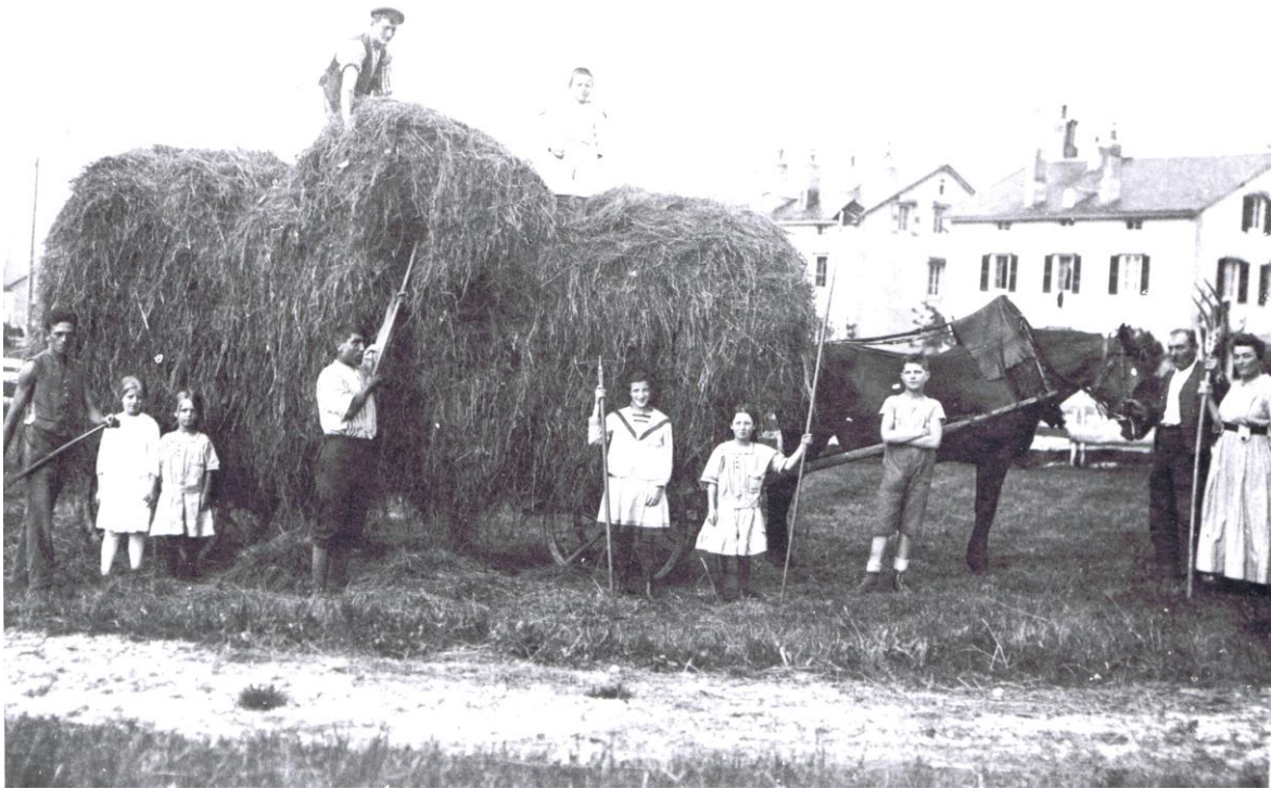
Les foins au Brassus.