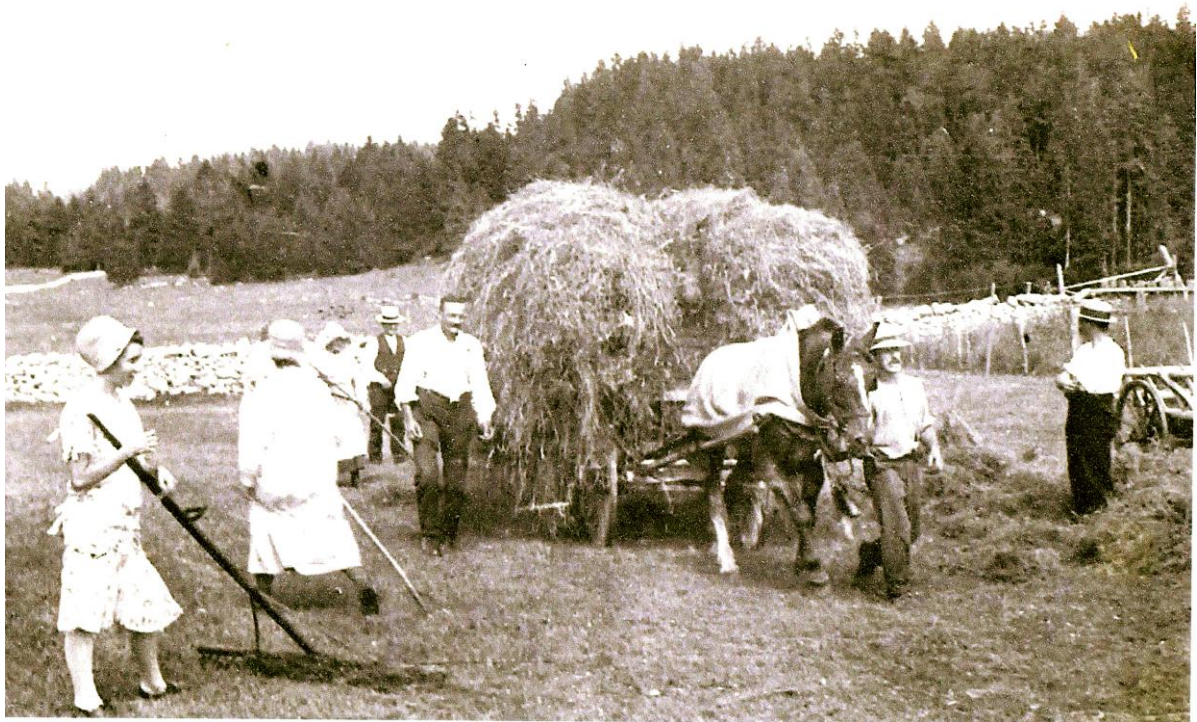
Les foins à la Frasse.