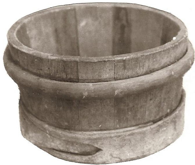
La guiche. Comme indiqué par CG, p. 79, ce petit baignolet est très souvent fait de deux bois différents.