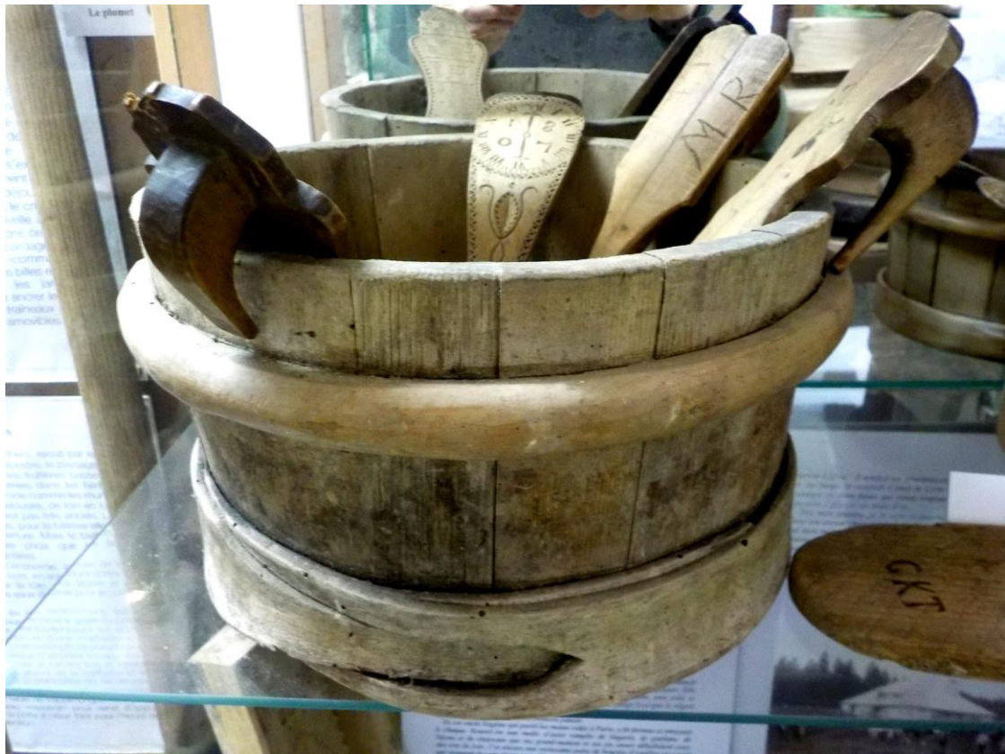
Guiche avec les cuillères à crème.