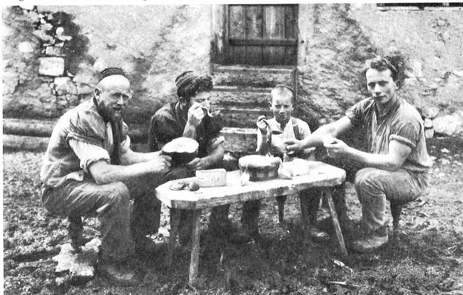
Bergers en train de manger la laitia, sans doute en Gruyère.