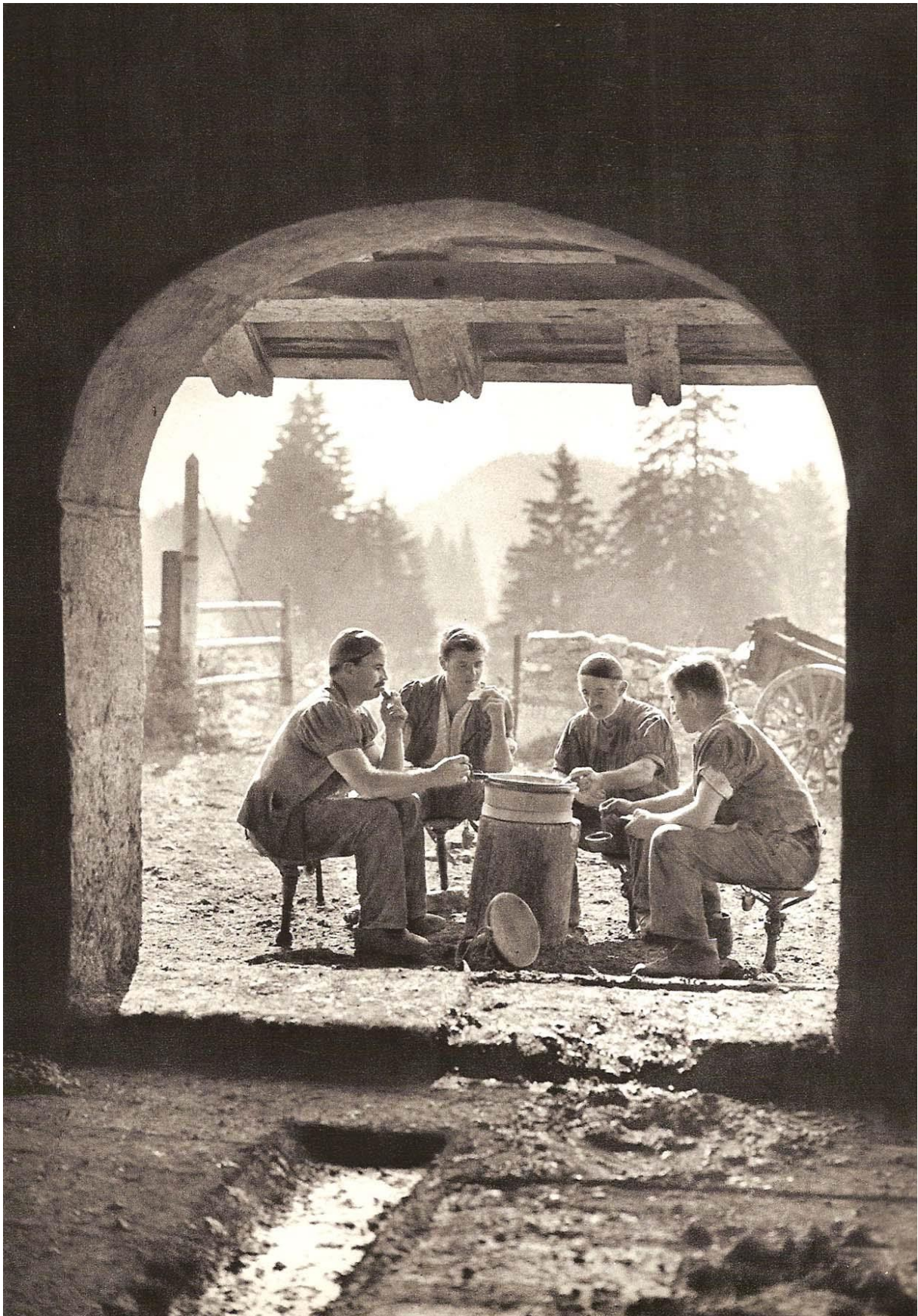
Idem. On n'est pas trop difficile, la bouse n'a pas encore été toute évacuée de l'écurie. Jura vaudois plutôt que les Alpes ou les Préalpes.