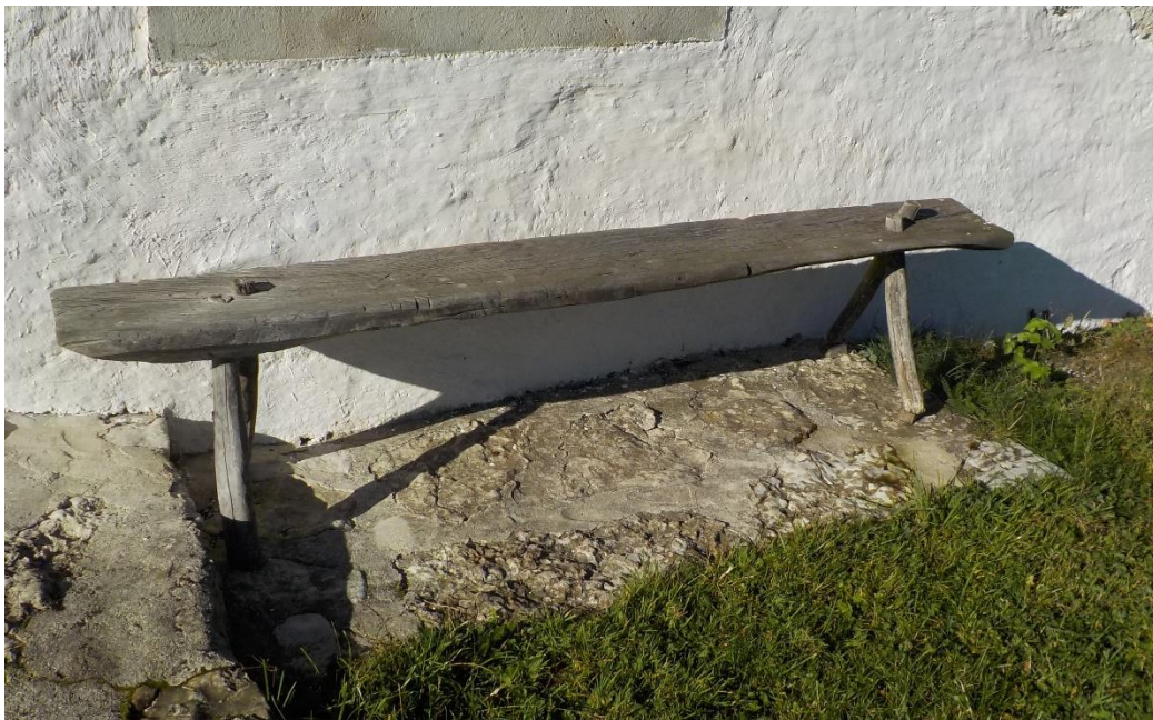
Banc de devant le chalet.