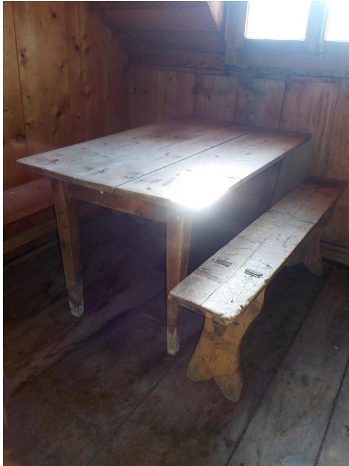
Table de la seconde chambre, dite la petite chambre, et bancs d'Arthur.