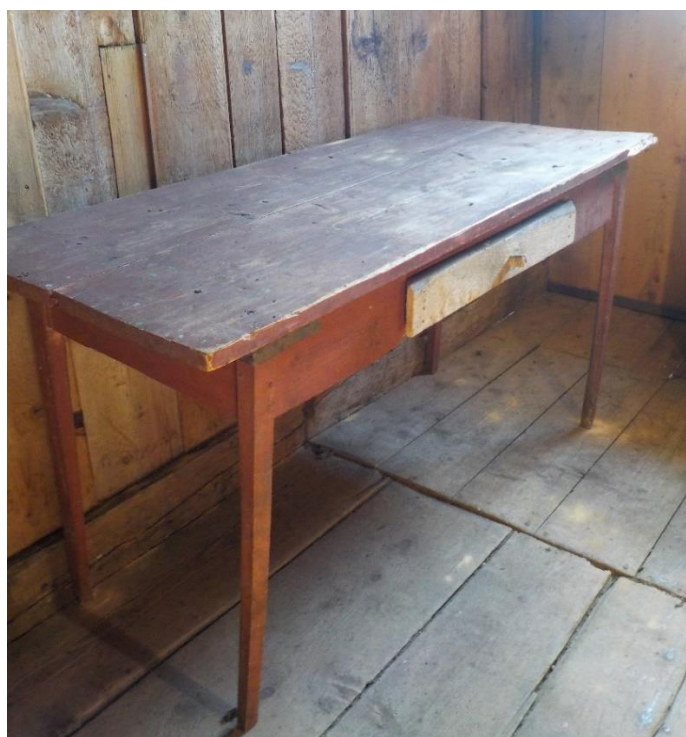
Table de l'une des deux chambres. Vieille et revieille diraient d'aucuns. Les cirons s'appliquent à ronger le chalet ! Cette table à servi dans le film promotionnel de la chasse au trésor intitulée : Le trésor du temps.

La table, montée du bas où elle n'avait plus d'utilité – c'était celle de la cuisine, elle a accueilli tous les repas de la maisonnée pendant des décennies ! – a retrouvé son état primitif. Elle est loin d'être genre minable ainsi qu'on le précisait plus haut, solide sur ses quatre pieds et prête pour affronter la suite des siècles !