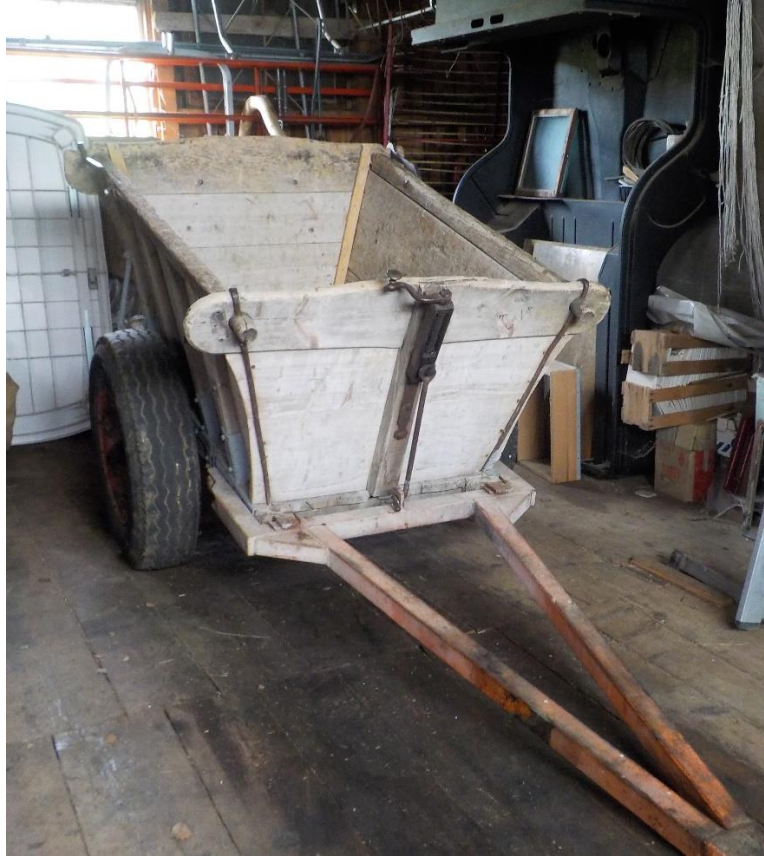
Le traîneau réadapté de Mollet de Derrière-la-Côte.