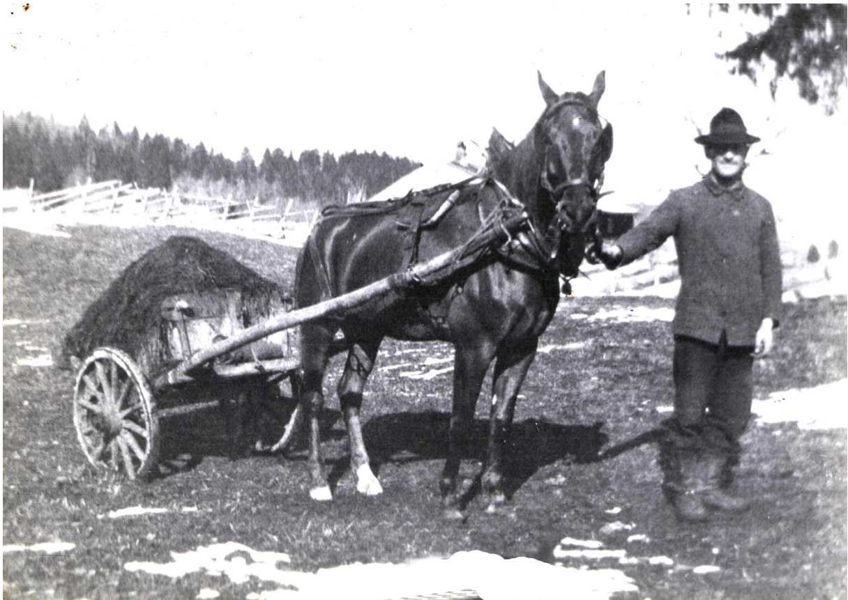
Frédéric Piguet de la Brasserie, fruitier possible au Mont de Cire.

Feu les tombereau, les machines à répandre le fumier sont aujourd'hui monstrueuses, évidemment sans poésie. A moins que l'on ne puisse quand même en trouver une en ces énormités qui traversent les villages à quarante à l'heure.