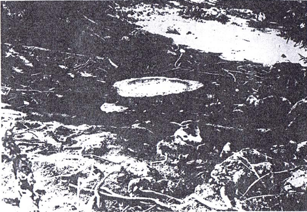
Fig. 1 - Situation du bloc en question dans son environnement: fond de doline. Vue prise du sud-est.