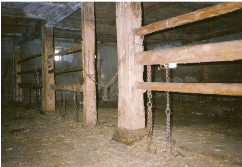
Les barres d'attache avec les liens.

A l'endroit des couchés, des « ranches », le sol de l'étable est revêtu de planches que l'on ôtait jadis en automne pour qu'il sèche mieux. Les mangeoires manquent généralement ; on attache les animaux à des barrières de perches. Souvent une cloison de planches ou un mur isole une partie de l'étable ; ce local spécialement protégé s'appelle le « latzaret » ; on y héberge des veaux ou des animaux malades.