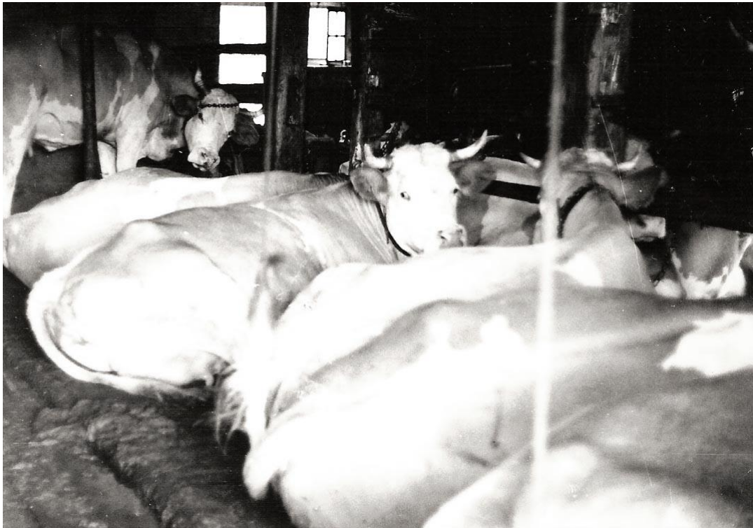
Le bétail dans les années septante. On a mis des ficelles aux queues afin lors de la traite de ne pas recevoir les poils terminaux de celles-ci dans les yeux, ce qui vous occasionne des brûlures terribles.