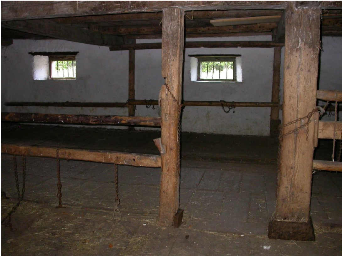
Un renouveau certain.