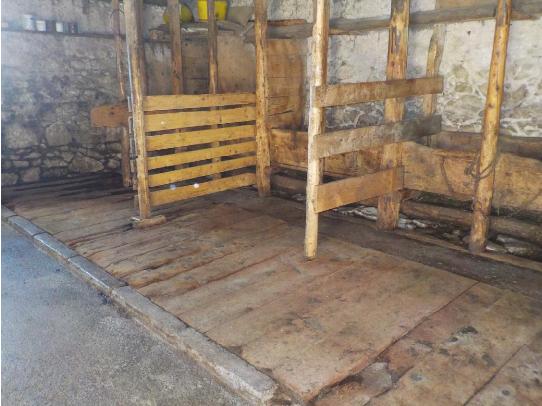
L'écurie de la Branette toute belle nettoyée au Kärcher