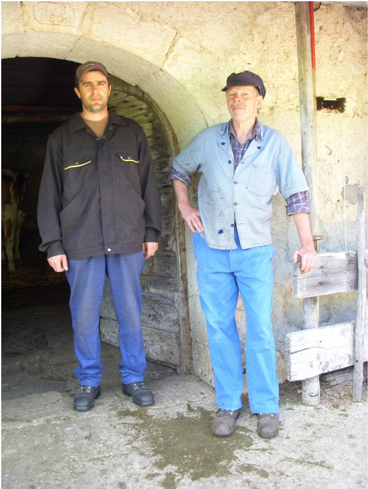
Devant la porte d'écurie en 2013.

Mais revenons une fois encore à Mallevaux-Dessus pour révéler plus d'éléments propres à l'écurie.