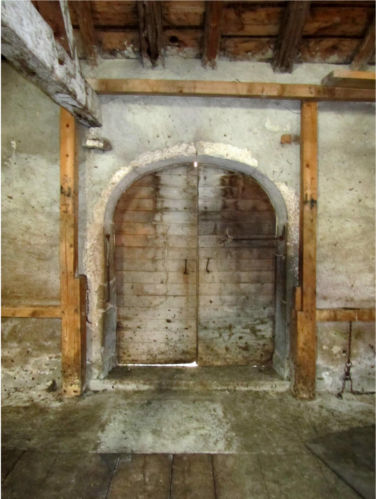
Porte voûtée de l'écurie côté sud-est.