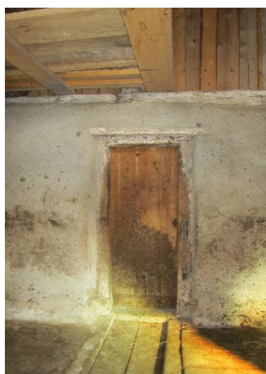
Chalet de la Petite-Chaux, avec l'écurie et la porte de communication avec la cuisine.