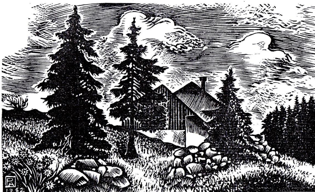
« Le chalet dans les sapins », « La Cerniaz », gravure inédite de Pierre Aubert.