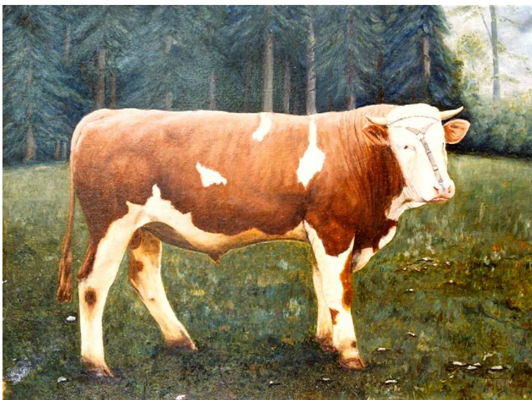
La photo donna lieu à une peinture de Tell Rochat, effectuée vers 1920.