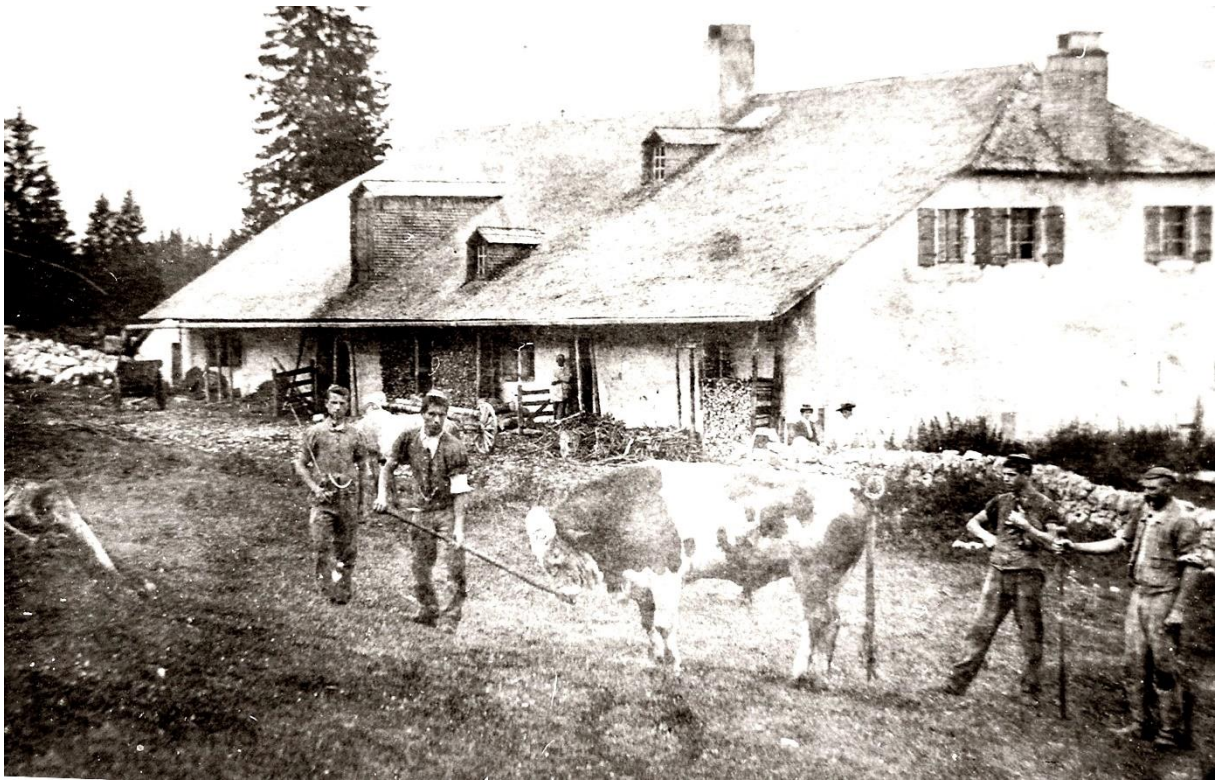
Le taureau de la Lande-Dessus. On ne fait jamais dans la fantaisie avec des bêtes de la sorte.

Ces taureaux redoutables – par Donald Aubert de Derrière-la-Côte, FAVJ du 9 août 1967 –