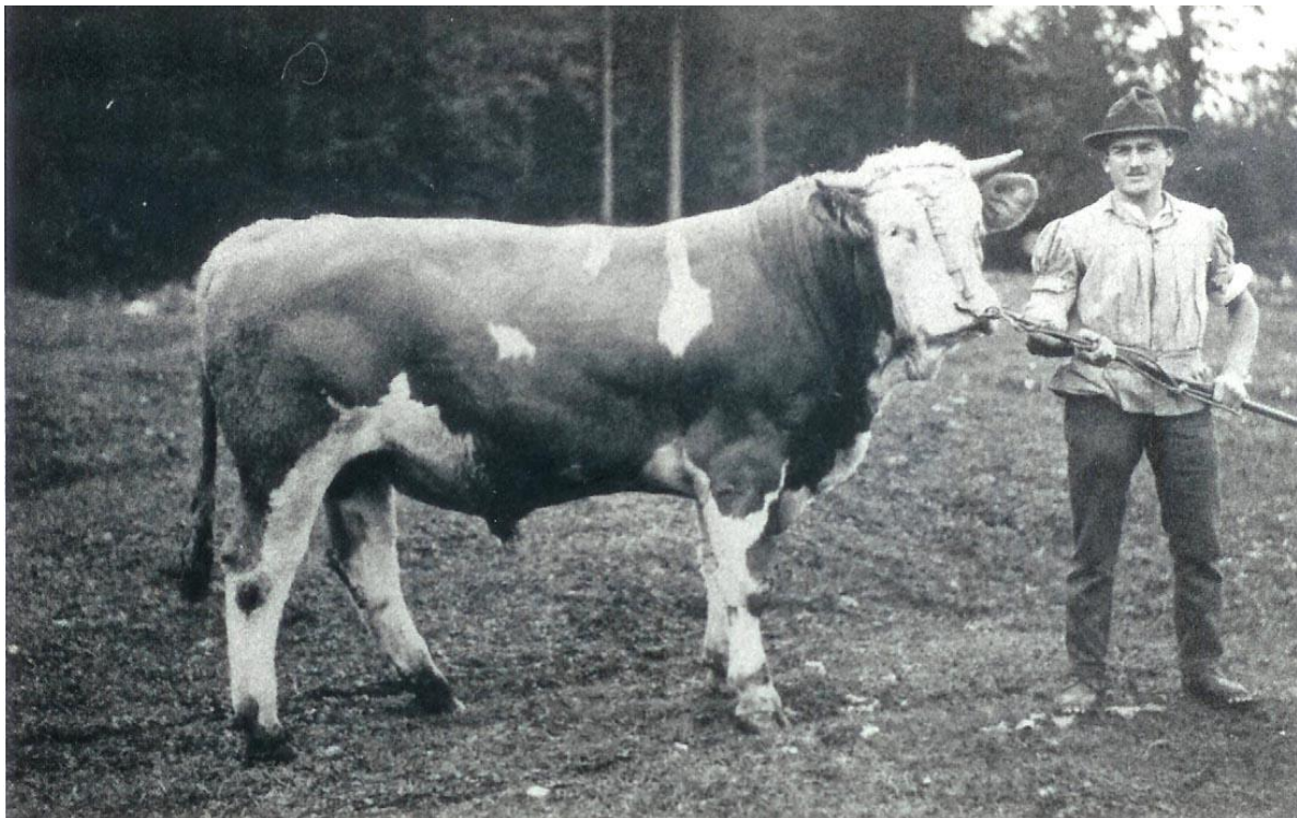
Millet et le Salomon.

- Vous vous épouvantez !, se contentait-il de répondre, ironique.