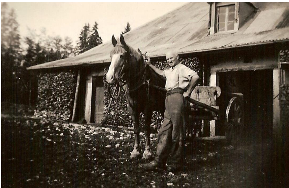
A la Muratte.

On arrive sur place par ces mauvais chemins qu'il y a. Ca a clapoté tout au long du voyage. On arrête la bête et le tombereau là où il faut, on enlève la porte arrière, on tire de la matière afin de faire un gros tas. Puis on avance et l'on recommence pour un second tas. Et ainsi de suite, jusqu'à ce que le tombereau soit vide. Pour certains, on peut les incliner, pour la deuxième moitié du chargement, c'est plus facile à faire sortir la matière. Enfin, des choses et des détails comme ça. Et l'on rentre au chalet à vide. Et on laisse le tombereau à proximité de l'écurie après avoir détaché le cheval ou la vache. Une bonne chose de faite.