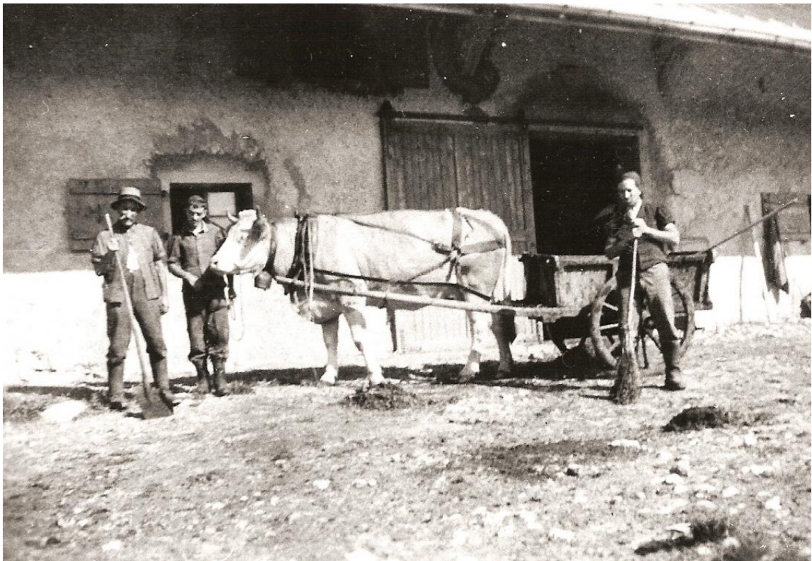
Aux Esserts, sur la commune du Lieu, c'est une vache. Nous y sommes dans les années quarante. Nous pouvons aussi admirer le balai dans sa presque utilisation.