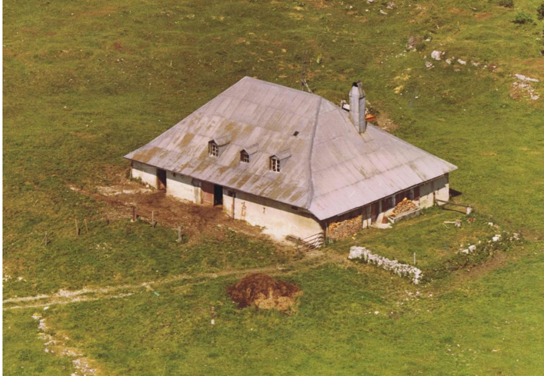
Mallevaux-Dessus et son fumier vus d'avion. Seule image de ce type.