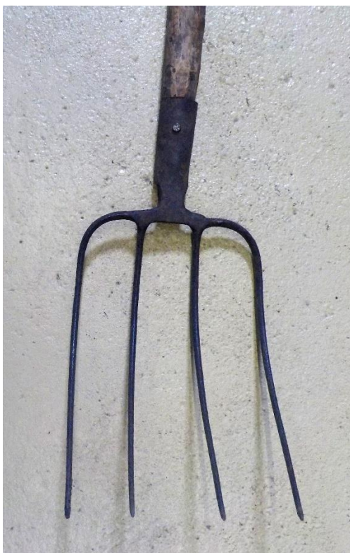
Un beau fer quand même.