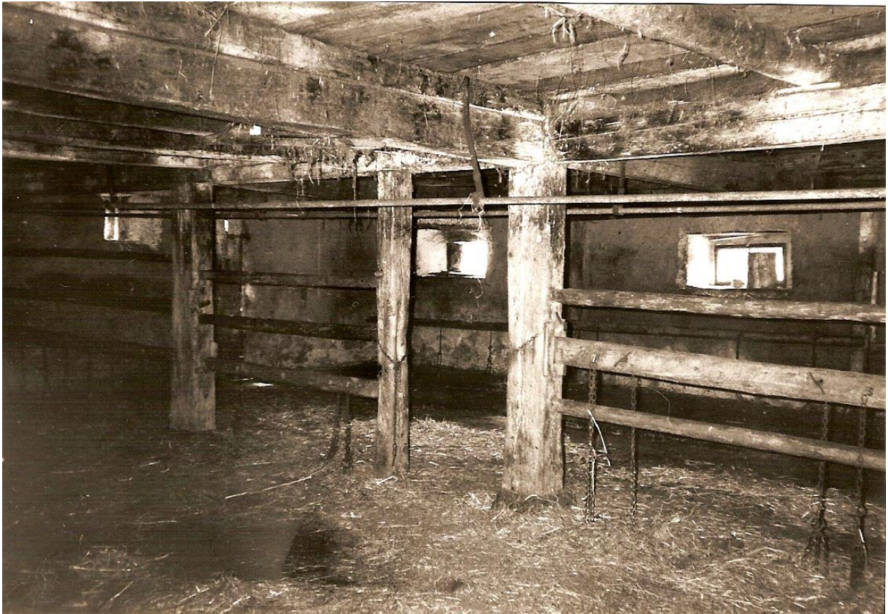
De la paille certes, mais une écurie désormais sans allure.

Sur le tard, on mit de la paille à l'écurie, constituant ainsi une litière pour le bétail. En conséquence, plutôt que de mener la bouse comme autrefois avec le tombereau ou une remorque quelconque attelée par exemple derrière la Land-Rover, on mettait ce qui constituait désormais du fumier dans la brouette et avec ce fumier on faisait un tas près du chalet. Nouvelles mœurs qui ne laissent par ailleurs que peu de traces. Ce fumier était ensuite épanché à la machine, à moins qu'il ne fût encore charrié en tas et ensuite épandu à la fourche sur quelque coin de pâturage. Fourche à quatre dents toujours, notre bon vieux trident !