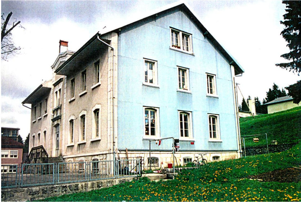
Le collège du Lieu en 1995. Les deux classes sont encore occupées en 2026, tandis que le collège des Charbonnières est désaffecté depuis 2000 environ.