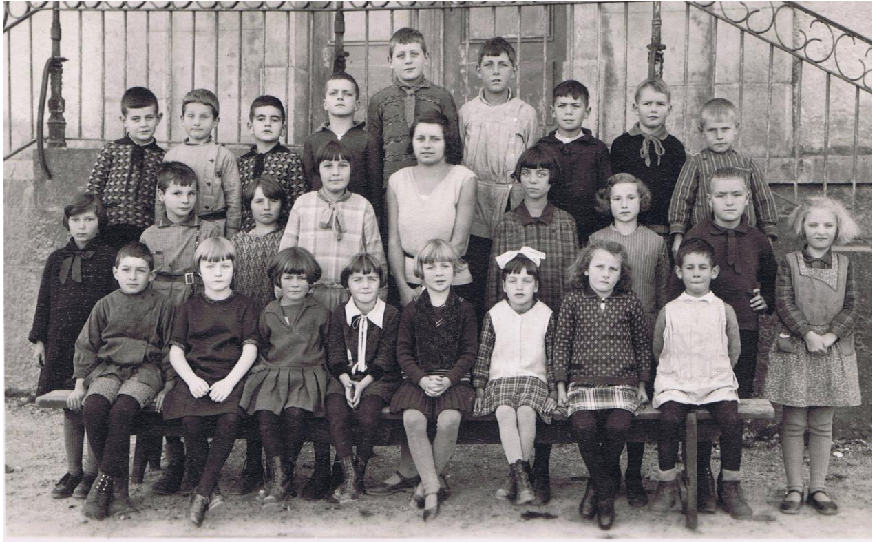
Petite classe du Lieu, avant 1926.