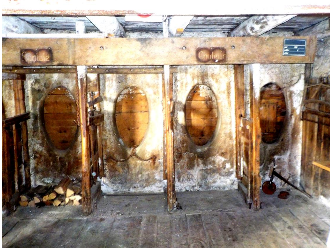
Avec le flash. Au-delà des ovales en ciment des crèches, les borancles.