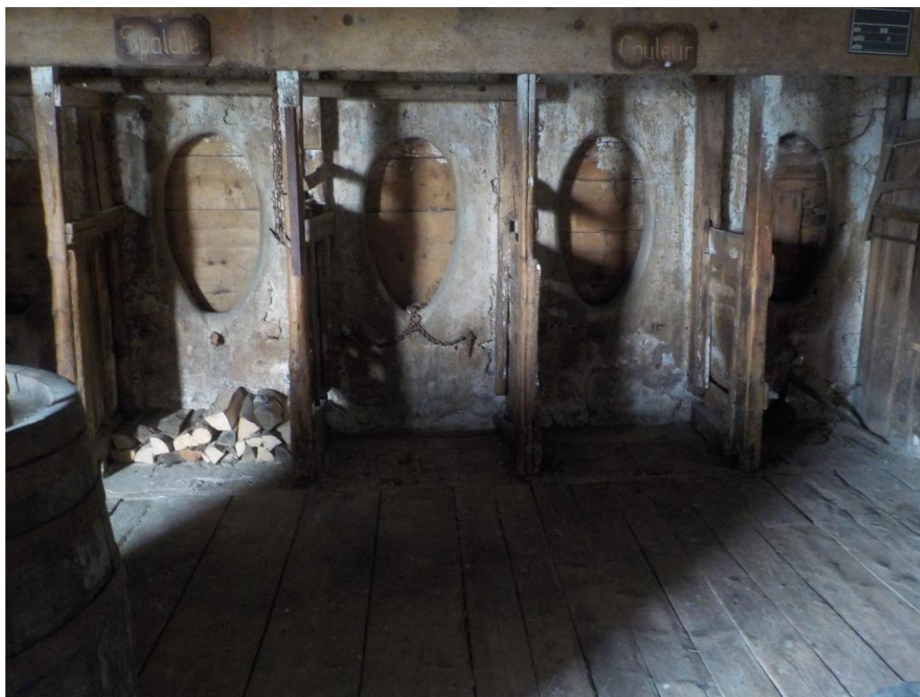
Sans le flash

Et l'on profite pour découvrir une dernière fois les crèches de l'écurie du Poste. Elle n'en a plus pour longtemps :